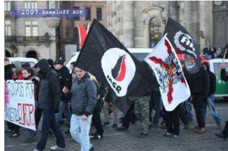
u. a. Allianza Nazionale AN aus Italien