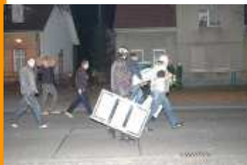
Neonazis ziehen ab. Die Grenze ist gezogen.