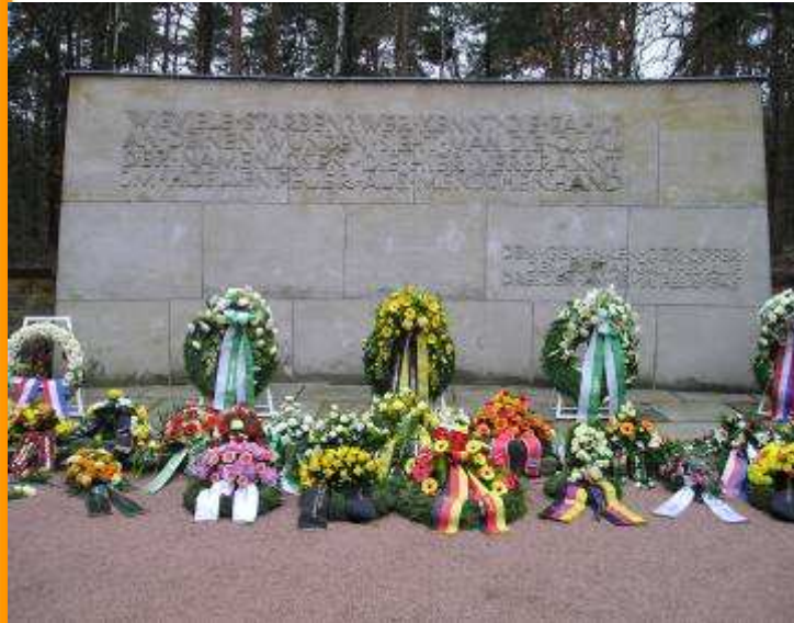
Foto: Heidefriedhof Dresden 2008, Kränze der rechtsextremen Parteien und Kameradschaften überwiegen