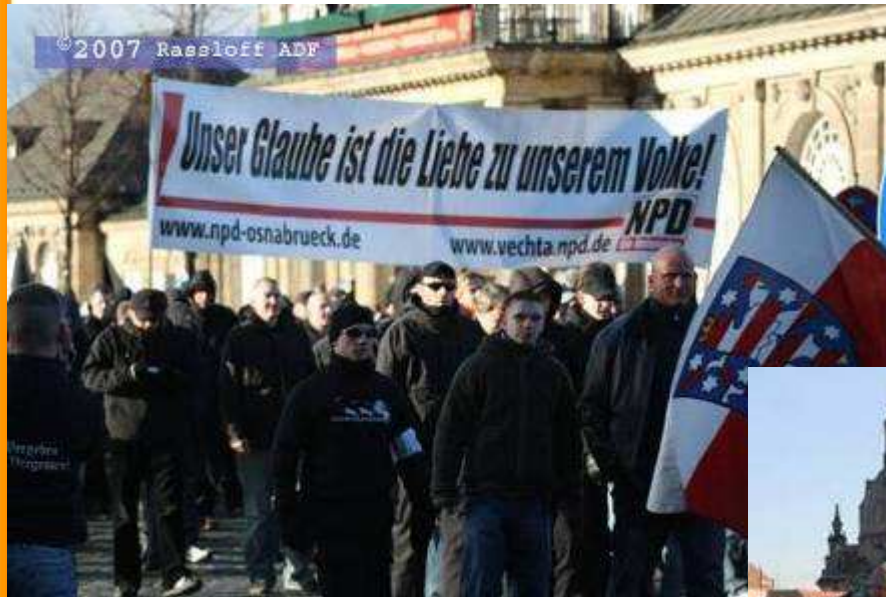
→ Bundesweit: NPD Osnabrück