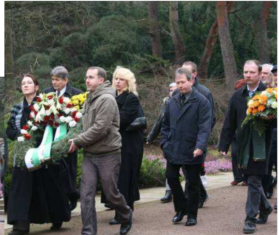
Foto: NPD Landtagsfraktion auf dem Heidefriedhof