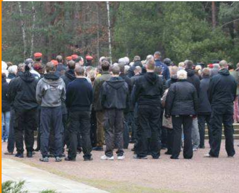
Foto: Neonazis auf dem Heidefriedhof, sie dominierten mit ca. 50 Teilnehmern das „stille Gedenken“ im Jahre 2008.

→ Die Dresdner Gedenkkultur des „stillen Gedenken“ ermöglicht modernen Neonazis die schleichende Übernahme von Gedenkort und -themen: