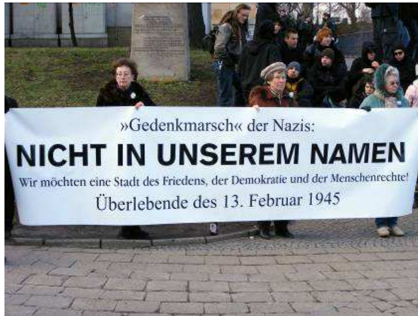
Foto: Geh Denken Demo der Zivilgesellschaft 2008

Zivilgesellschaftlicher Widerstand in Dresden braucht dringend die Unterstützung aktiver DemokratInnen aus ganz Europa.