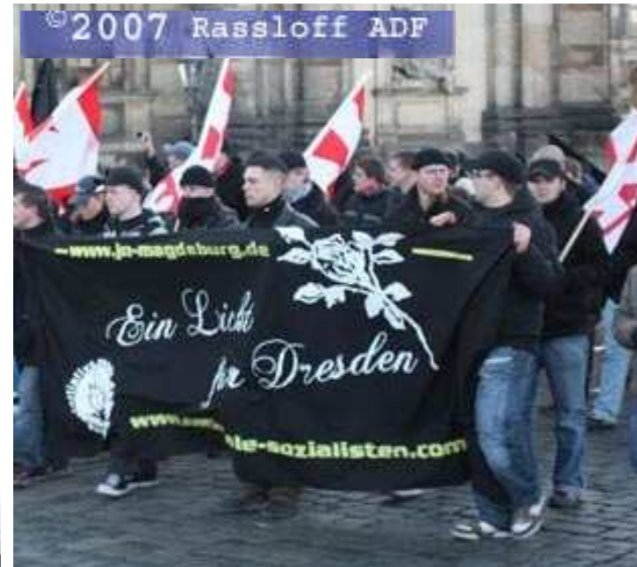
Foto: oben rechts: JN Magdeburg mit der „Weissen Lilie“ am 14.2. 2008

→ bürgerliche bzw. christliche Symbole der Erinnerungskultur werden okkupiert/kopiert: