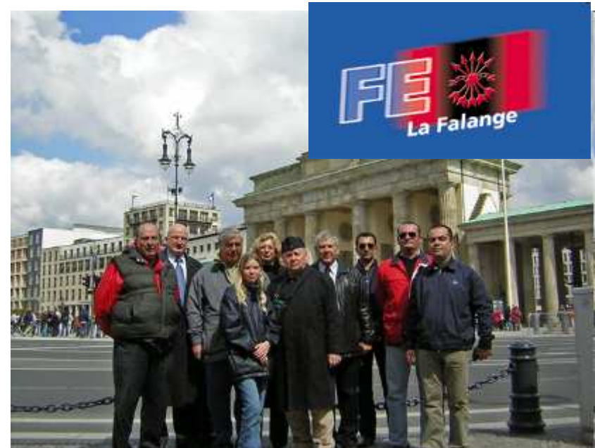
Gruppenbild mit Udo Voigt (NPD) vor dem Brandenburgertor in Berlin

MARCHA EN DRESDE EL 11 DE FEBRERO CONTRA LAS BOMBAS DEL TERROR DE 1945