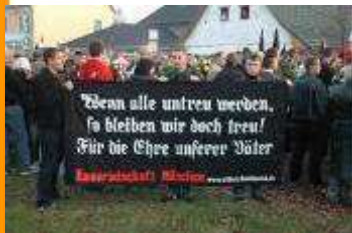
Freie Kameraden aus München