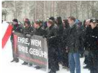
Die sächsische NPD Fraktion in Halbe

In Halbe konnten die Neonaziaufmärsche erfolgreich als Propaganda rechtsextremer Überzeugungstäter öffentlich gemacht werden. Das entschlossene und gemeinsame Handeln der demokratischen BürgerInnen und MandatsträgerInnen führte bis 2008 zur Bedeutungslosigkeit und Unmöglichkeit dieser Neonaziveranstaltung.