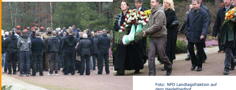
auf dem Heidefriedhof

→ Die Dresdner Gedenkkultur des „stillen Gedenken“ ermöglicht modernen Neonazis die schleichende Übernahme von Gedenkort und -themen: